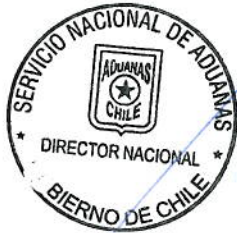
JOSÉ IGNACIO PALMA SOTOMAYOR DIRECTOR NACIONAL DE ADUANAS

ANÓTESE, COMUNÍQUESE Y PUBLÍQUESE EN EXTRACTO EN EL DIARIO OFICIAL Y EN FORMA INTEGRAL EN LA PÁGINA WEB DEL SERVICIO